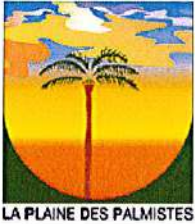
LA PLAINE DES PALMISTES